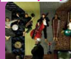
Nèggus & Kungobram